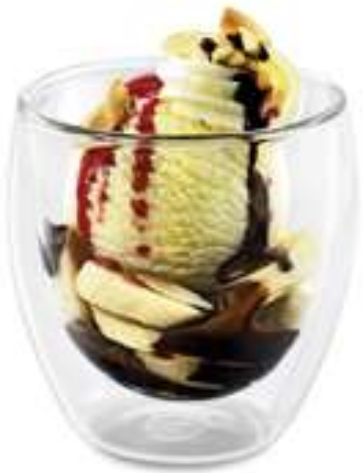
MINI BANANENSPLIT Vanille-Rahmglace Bananenscheiben und Schokoladensauce und Rahm CHF 6.50