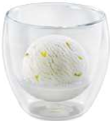
COLONEL FRESH Zitronen-Sorbet mit Vodka CHF 7.50