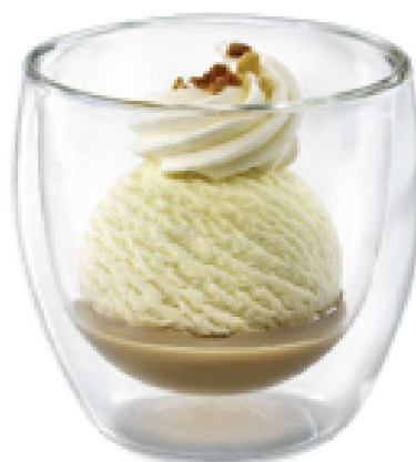
VANILLE AU BAILEYS Vanille-Rahmglace Baileys und Rahm CHF 8.50