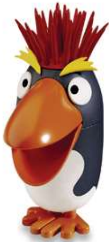
PUNKY Vanille-Glace CHF 6.00