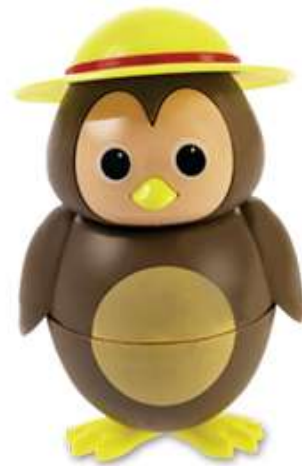
BIRDY Schokolade-Glace CHF 6.00