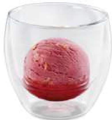
SORBET APEROL Blutorangen-Sorbet mit Aperol CHF 7.50