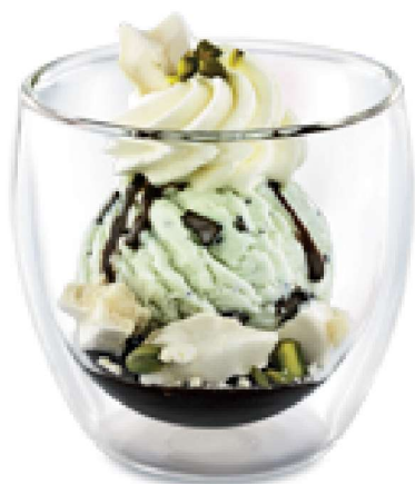
FROCHKÖNIG Pistazien-Rahmglace Meringues-Stückli Schokoladensauce und Rahm CHF 6.50