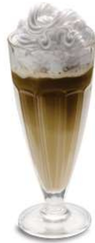
ICE CAFÉ Café-Rahmglace mit Rahm CHF 10.50 / Mini CHF 8.50 mit Kirsch + CHF 2.00